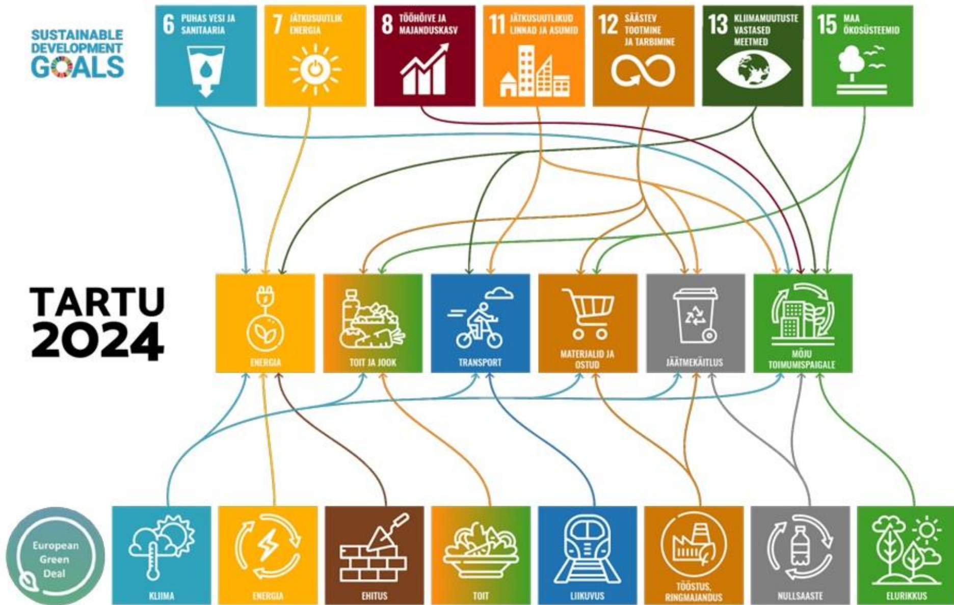
Joonis: Tartu 2024 keskkonnavaldkondade seos rahvusvaheliste keskkonnaeesmärkidega