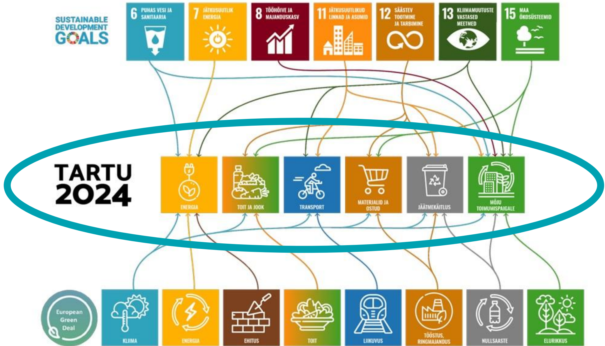
Joonis: Tartu 2024 keskkonnavaldkondade seos rahvusvaheliste keskkonnaeesmärkidega