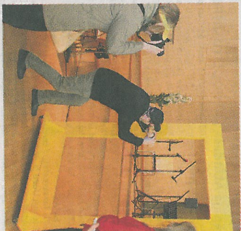
Rõugelased turistideks kehastatuna tutvustas oma piirkonna kollast akent.

mase 11 aasta jooksul uhkeimalt peetud näituse avamisel pakuti ehisat võrumaist toitu, turismipiirkonnad jagasid oma infot ja buklette ning muusikalisi vahetalu pakkus ansambel Võru veld.